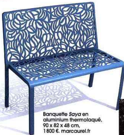
Banquette Saya en aluminium thermolaqué, 90 x 82 x 48 cm, 1 800 €. marcaurel.fr

18 € le tube de 100 g. jardinsdegala.com